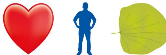
La D, representa la naturaleza y expresa nuestra responsabilidad ambiental.

Insistimos en el uso adecuado de los servicios públicos, racionalizando el agua, apagando luces, ventiladores, entre otros, así cuidamos nuestra Casa Común.